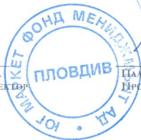
ЦАМЕН ГЕОРГИЕВ ПРОКУРИСТ